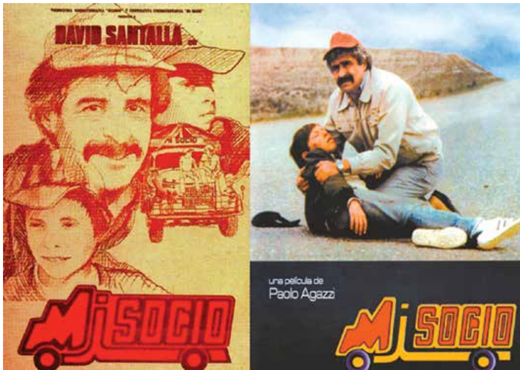
Figura 1. Afiches promocionales de Mi Socio

El análisis está descrito en tablas que sistematizan el proceso de observación con base en una secuencia lógica planteada en la propuesta de Aristizábal y Pinilla (2017). Las tablas 3, 4 y 5 corresponden a una película y las tablas 6, 7 y 8 a la otra, respetando las fases descriptiva, integral e interpretativa. Con este modelo integral se fusionan tanto el análisis instrumental como el interpretativo. Este será discutido más ampliamente en el siguiente acápite. El análisis comienza con la película Mi Socio .